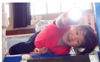
影や光を使った遊び、楽しいね！