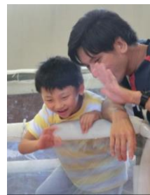
好きな遊びを見つけて、ステキな笑顔がいっぱい！