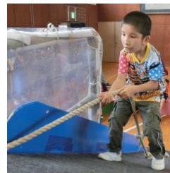
パラシュートを落とさず、上手にキャッチ！！ ロープを使って、早登り競走！「よいしょ、負けないぞ〜」