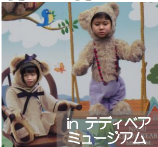
in テディベアミュージアム

6月27日（水）～29日（金）の二泊三日で、那須方面へ。ソーセージやアイス作り、乳搾り、お菓子作りと体験盛りだくさんの旅行となりました。天気が危ぶまれましたが、全ての行程を無事、終了。写真やしおりで振り返りながら、お土産話に花が咲きました。